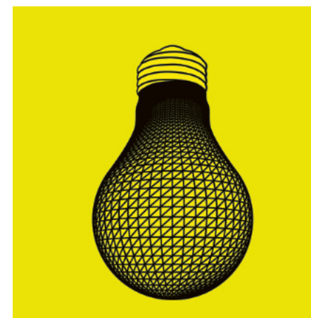
Peter Kogler, Ohne Titel, 2009