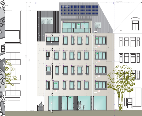
7 Neubau Mehrfamilienhaus Bahnhofstraße 20 Privater Investor, 2022 bis 2023

Abbruch und Neubau eines Mehrfamilienhauses mit einer Ladeneinheit im Erdgeschoss zur Bahnhofstraße. In den oberen Geschossen sind Eigentumswohnungen geplant.