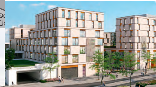
9 Projekt PULSE Böblinger Baugesellschaft (BBG), 2021 bis 2024

Abbruch und Neubau eines Mehrfamilienhauses mit einer Ladeneinheit im Erdgeschoss zur Bahnhofstraße. In den oberen Geschossen sind Eigentumswohnungen geplant.