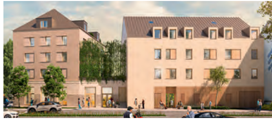
1 Hospiz Talstraße / Karlstraße Böblinger Baugesellschaft (BBG), 2022 bis 2024

In der folgenden Aufstellung und im Stadtplan (Stand März 2022) erhalten Sie einen Ausblick auf aktuelle und künftige Baumaßnahmen verschiedener Investoren in der Unterstadt. Bitte beachten Sie, dass sich die angegebenen Zeiträume, insbesondere die der geplanten Fertigstellung, auch kurzfristig ändern können.