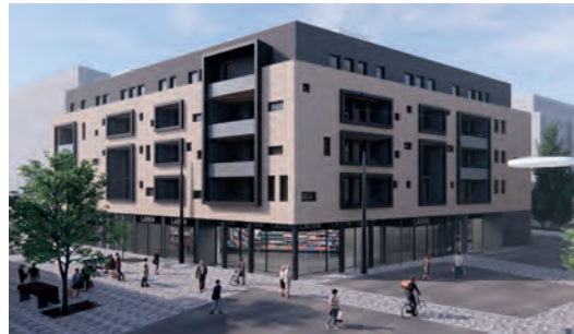
4 Inside BB BB Wohnbau Böblingen, 2022 bis 2024

Verlängerung der Fernwärmeleitung und Herstellung des Hausanschlusses für das Hospiz. Kontakt: www.stadtwerke-boeblingen.de