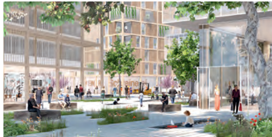
3 Postareal Böblinger Baugesellschaft (BBG), 2023 bis 2026

Kontakt: www.bbg-boeblingen.de