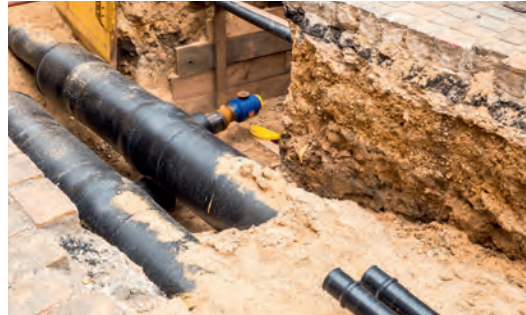
2 Fernwärme Karlstraße Stadtwerke Böblingen im Auftrag der Fernwärme Transportgesellschaft, 2022

Kontakt: www.bbg-boeblingen.de Foto: Büros Gutiérrez – De la Fuente Arquitectos SLP Madrid in Zusammenarbeit // UTA Architekten und Stadtplaner GmbH Stuttgart