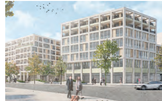
10 Mühlbachquartier Böblinger Baugesellschaft (BBG), 2024 bis 2027/2028

Auf dem Gelände des heutigen Einkaufszentrums (EKZ) hat die Böblinger Baugesellschaft einen Architekturwettbewerb durchgeführt. Vorgeschlagen sind rund 150 Wohnungen, eine Kita mit Familienzentrum sowie Büro- und sonstige Gewerbeflächen. Dabei sollen große Teile des Areals begrünt werden. Eine neue Passage soll den Durchgang des Quartiers PULSE aufnehmen und diesen bis zur Mühlbachstraße fortführen.