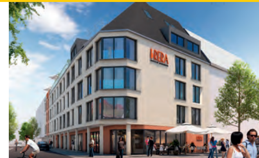
8 Boardinghouse Ecke Bahnhofstraße / Wilhelmstraße Wilhelm-Invest München, 2022 bis 2025

Kontakt: www.bbg-boeblingen.de Foto: Steinhoff/Haehnel Architekten Stuttgart