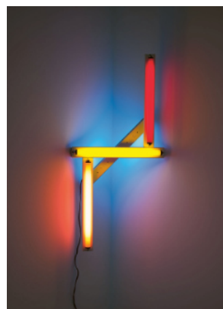
Dan Flavin, Ohne Titel to Paolina, 1971