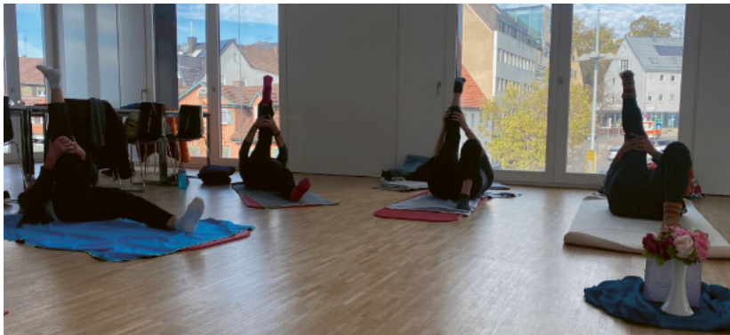
Beweglichkeit der Gelenke, Dehnung und Kräftigung des Muskel- und Halteapparates, Atemübungen und Entspannung für Körper, Geist und Seele.

🕒 Dienstags ab 4. März 2025, 11.15 bis 12.45 Uhr Folgekurs ab September 2024 Treff am See, Saal